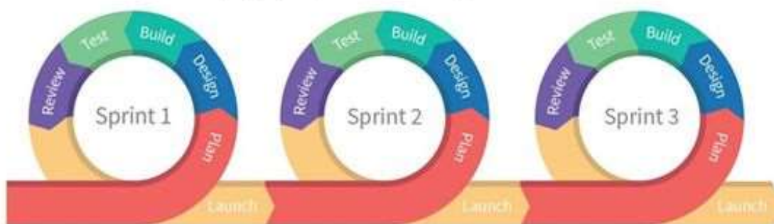
Schemat Zarządzanie zwinne w koordynacji działań instytucjonalnych i pozainstytucjonalnych z reakcją na zmienne warunki

Monitoring usług społecznych odbywa się w sposób ciągły i zwinny. Ciągły, ponieważ usługi społeczne wymagają długoterminowej pracy i są współzależne od siebie. Zwinne, gdyż usługodawca na bieżąco (zwinnie, elastycznie) dostosowuje usługę do zindywidualizowanych potrzeb odbiorców i pozostałych zmian warunków, tak by efekt końcowy był satysfakcją dla odbiorcy usług.